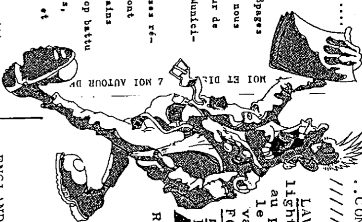
2 MOI AUTOUR DE... MOI ET DI... CI A BIEN TOI...

FRANCE... REGION NORD... Le single d'EXPEDITION PUNITIVE est toujours disponible (écrire G Colombani 200, rue de l'abbé bonpain 59 800 Lille) à remanquer sur ce single un très bon titre "Midnight in the Subway".